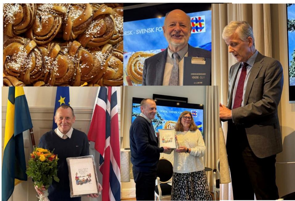
Prisutdelning på svenska ambassaden.